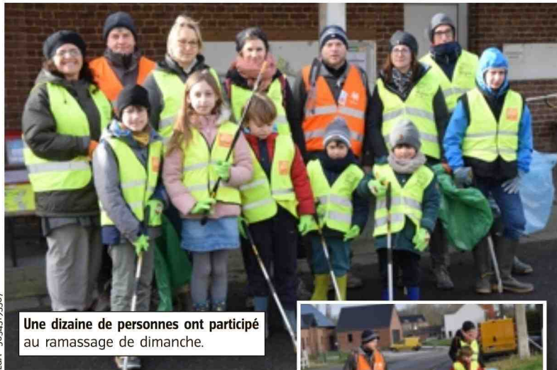
Une dizaine de personnes ont participé au ramassage de dimanche.